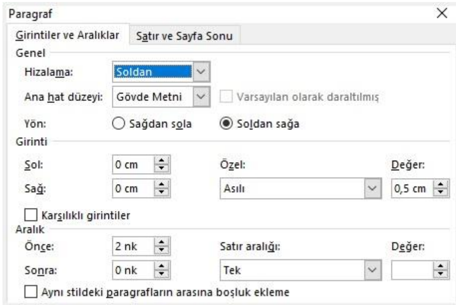
Şekil 3. Dipnot için girinti ve aralıklar