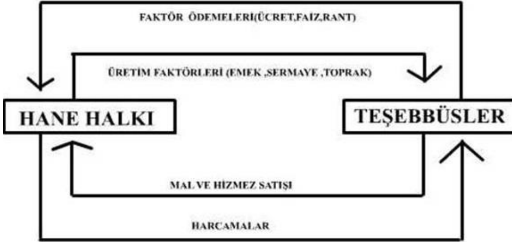
Şekil 7. Ekonominin döngüsel akımı